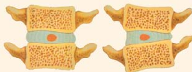
Disque intervertébral normal